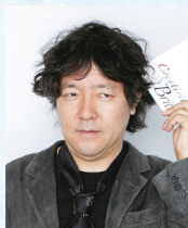
脳科学者 茂木 健一郎