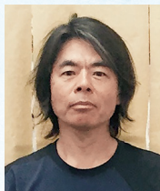
アーティスト 日比野 克彦