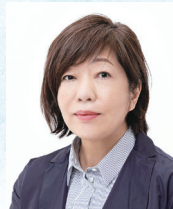
作家 林 真理子