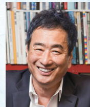
作曲家 三枝 成彰