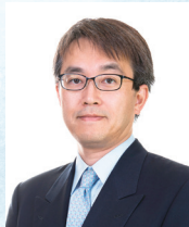
将棋棋士 羽生 善治