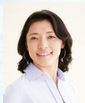
経済評論家 勝間 和代