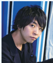
メディアアーティスト 落合 陽一