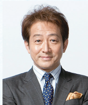
俳優 / 「日本のワインを 愛する会」会長 辰巳 琢郎