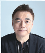
作家 / 大正大学表現 学部客員教授 井沢 元彦