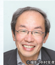
コミュニケーション工学者 東京大学名誉教授 原島 博