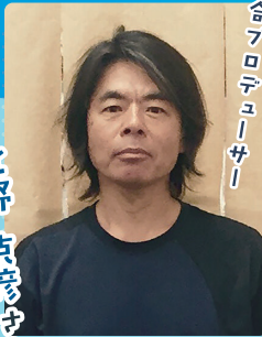
総合プロデューサー