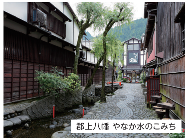
郡上八幡 やなか水のみち