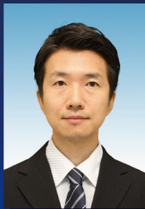
作曲 / 新倉 一梓