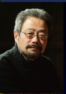
台本 / 高木 達