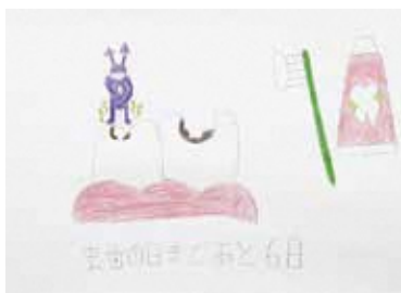
● 平井和樹 / 「虫歯の日(6/4)まであと6日」色鉛筆、鉛筆、紙