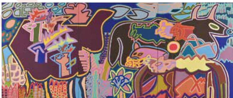
● 山野将志 / 「富士山の山のくじらぐも 角はえた鹿の群れと大きな黒い牝牛」アクリル、キャンバス

※「エイブル・アート展」は障がいのある人たちが生の証として生み出した作品を「可能性(able=エイブル)の芸術」として紹介する展覧会です。