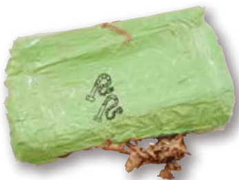
● 荒井陸 / 「掃除機と掃除機」数十個の様々な種類のテープ、ペン、パネル